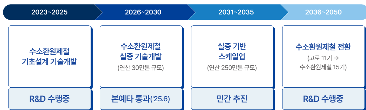
[그림 1] 산업통상부 수소환원제철 전환 로드맵

연구개발 단계에 불과했던 한국형 수소환원제철 기술은 2025년 6월 예비타당성 조사를 통과하며 본격적인 기술 실증이 진행될 예정이다. 확정된 총사업비는 8,146억 원(국비 3,088억 원, 민간 5,058억 원)이며, 2026년부터 2030년까지 포항에 연산 30만 톤 규모의 실증 플랜트를 구축하고 한국형 수소환원제철 기술의 실증 기반을 확보하는 것을 목표로 하고 있다.