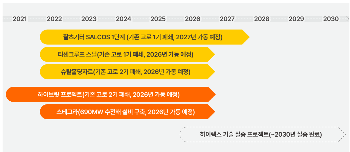
[그림 3] 각국 수소환원제철 상용화 진입 일정

다음 [그림 3] 은 이러한 맥락에서 각국 철강사별 상용 전환 프로젝트의 주요 내용과 예상되는 상용화 진입 일정을 정리한 것이다.